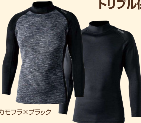
カモフラ×ブラック