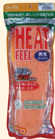
※画像は男性用です