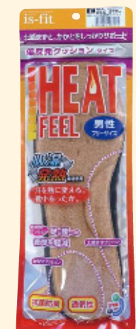
※画像は男性用です